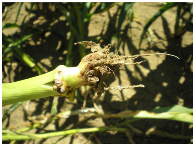
Dégâts causés par la larve de la chrysomèle sur les racines de maïs.

Même si la chrysomèle adulte se nourrit d'autres plantes que le maïs, elle conserve comme habitat le champ de maïs d'où elle a émergée. En période de déplacement, la chrysomèle adulte migre vers d'autres champs de maïs pour pondre ses œufs, ce qui explique les dommages plus importants causés par les larves sur les parcelles de culture intensive de maïs. Des dégâts causés par les larves et des céréales versées sont parfois visibles à la lisière des champs de maïs de première année lorsque ceux-ci sont situés à proximité d'un champ où du maïs a été cultivé l'année précédente. En Europe, jusqu'en 2009, il n'a pas été constaté de dégâts causés par les larves dans les cultures de maïs de première année. Il n'a pas non plus été observé une adaptation des populations de chrysomèles à la rotation des cultures, contrairement à ce qui se passe aux États-Unis.