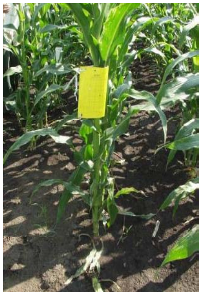
Piège collant jaune Pherocon AM pour estimation de la population adulte mâle et femelle.

cause rarement des dégâts importants, sauf lorsqu'elle se nourrit des soies de maïs avant et après la pollinisation. Cette 'section des soies' empêche la formation des grains générant des pertes en termes de quantité et de qualité des récoltes, surtout pour les producteurs de maïs en grains. La chrysomèle adulte se nourrit également des grains les plus tendres au sommet des épis.