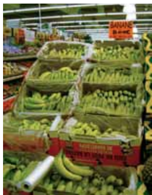
La législation apparaît être un facteur clé dans la réduction de l'utilisation de pesticides dans les régions européennes productrices de bananes. La consommation moyenne de bananes dans la Communauté Européenne était de 10,7 kg par habitant en 2007.